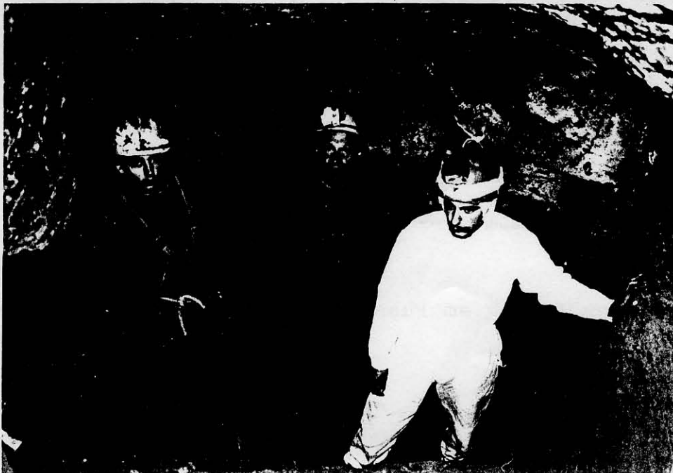
Saal im neuen Teil des Csörgő-Loches